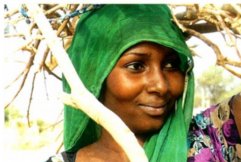
← Zerzura di Christopher Kirkley.