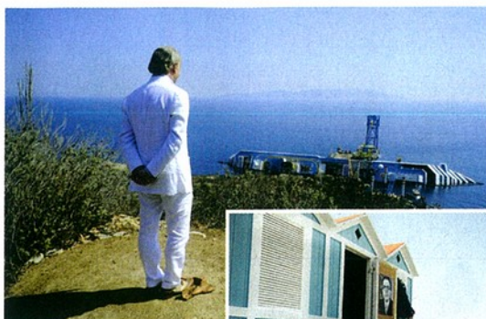
↑ Sopra, La grande bellezza , di Paolo Sorrentino. A destra, La mafia uccide solo d'estate , di Pif.

Organizzazione: www.comune.rosignano.livorno.it