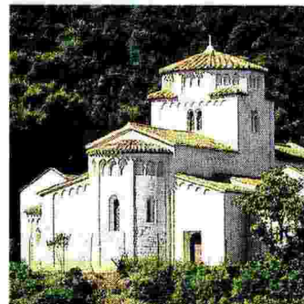
Sopra, un'immagine della Chiesa Romanica di Santa Maria

Ritaglio stampa ad uso esclusivo del destinatario, non riproducibile.